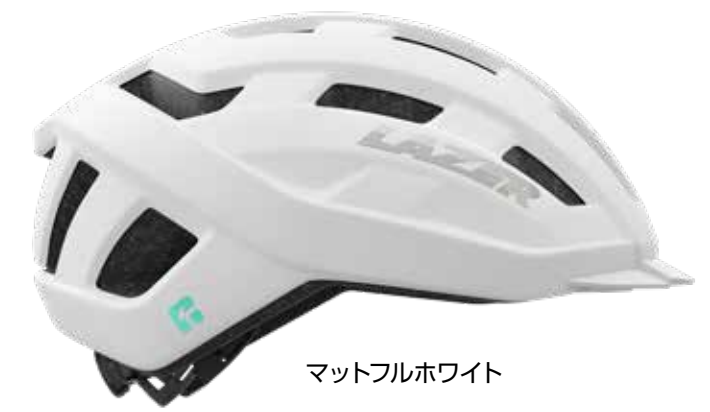
マットフルホワイト