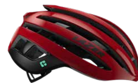
メタリックレッド