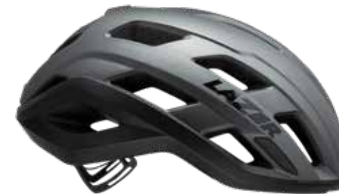
マットチタニウム