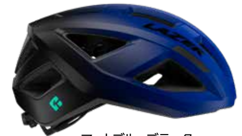
マットブルーブラック