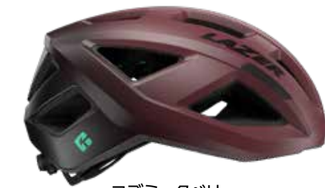
コズミックベリー ※ M,L のみ