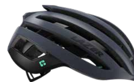
コズミックブルー