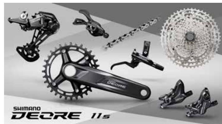
M5100・1×11 スペックイメージ