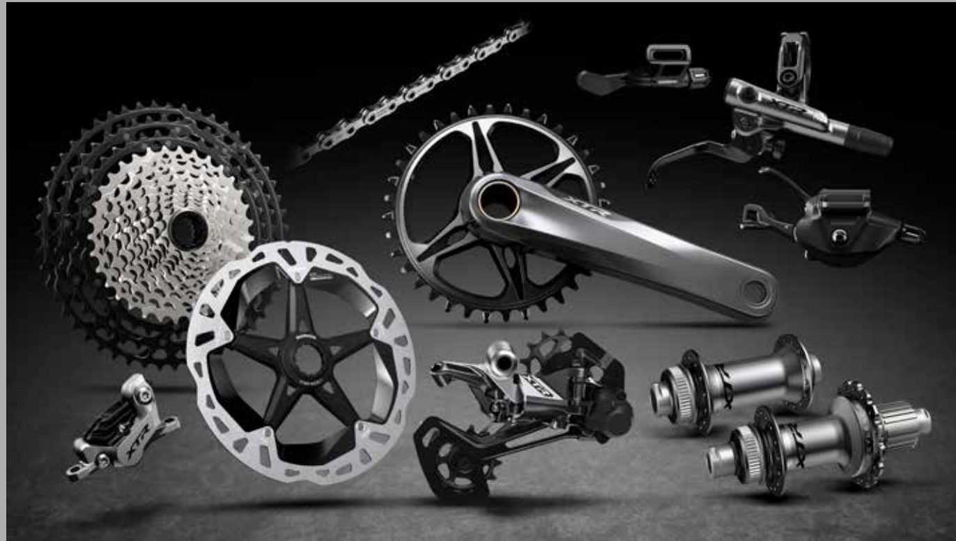
1 × 12 エンデューロ スペックイメージ

IT'S THE ATTITUDE THAT MAKES YOU SECOND TO NONE, M9100 SERIES