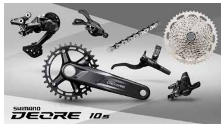
M4100・1×10 スペックイメージ