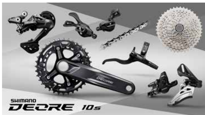
M4100・2×10 スペックイメージ