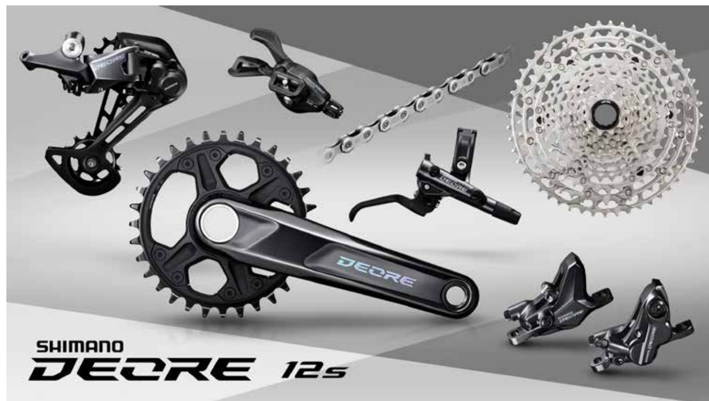
M6100 スペックイメージ