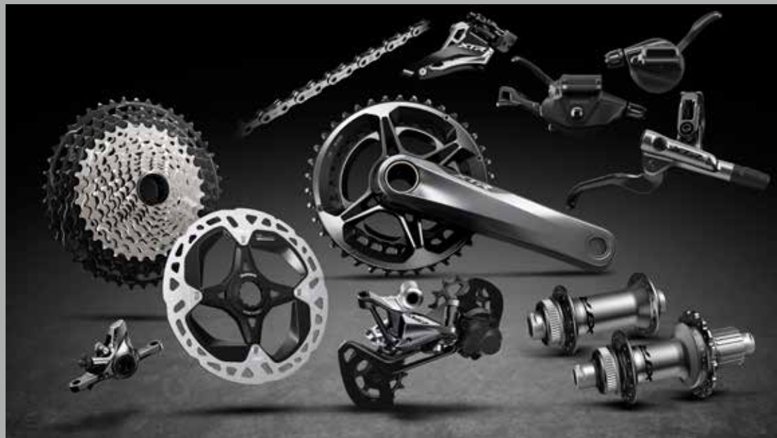
2 × 12 マラソン スペックイメージ

IT'S THE ATTITUDE THAT MAKES YOU SECOND TO NONE, M9100 SERIES