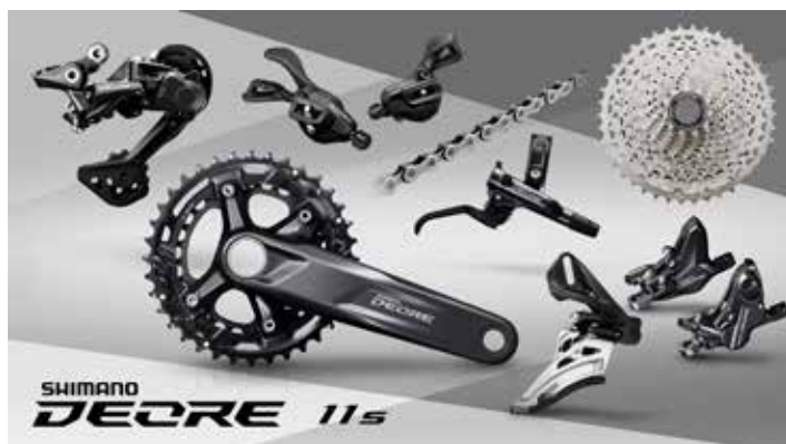
M5100・2×11 スペックイメージ