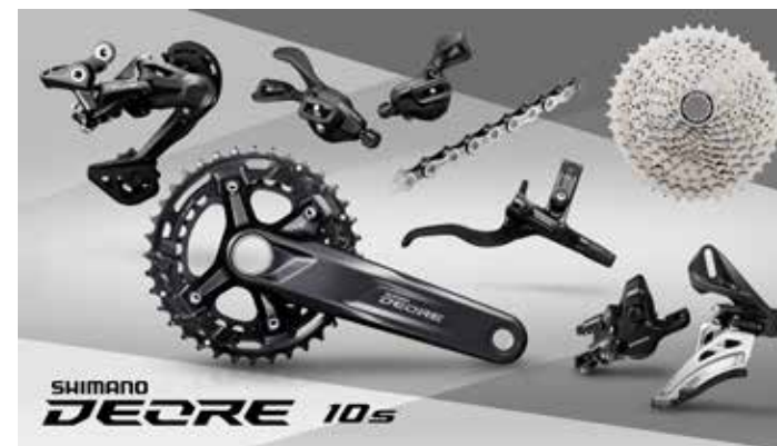
M4100・2×10 スペックイメージ