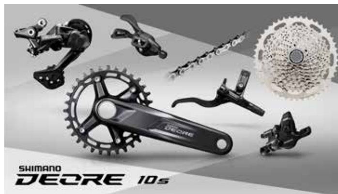
M4100・1×10 スペックイメージ