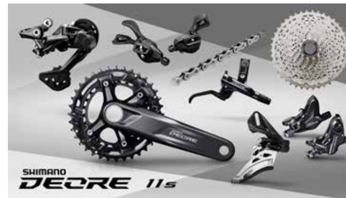
M5100・2×11 スペックイメージ